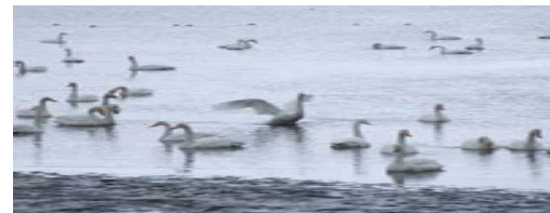
十三湖の コハチヨ