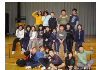
(お楽しみ会第1部終了後の1コマ)

2学期。長い学期なので、中だるみと思われる態度・行動ができました。そんなとき、「喝！！」を入れつつ、また持てる力を出させたいがために、目をつり上げながら気合いを注入。ふり返ると大きな声を出してばかりの日々でした。しかし、よく食らいついてくれた子ども達。へこんでも次の時間にはまた成長が見られました。卒業はもう目の前。3学期はさらに厳しいことを要求しちゃうと思いますが、根性と絆で乗り越えましょう。覚悟はいい？