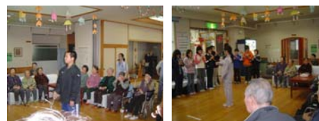
(リコーダー：指揮者ときのもるダウ、しほの木星)